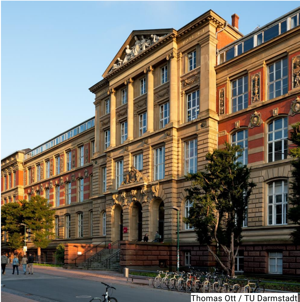
Thomas Ott / TU Darmstadt