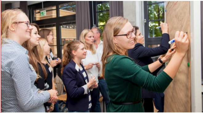
Teilnehmerinnen des Careerbuilding-Programms der Femtec